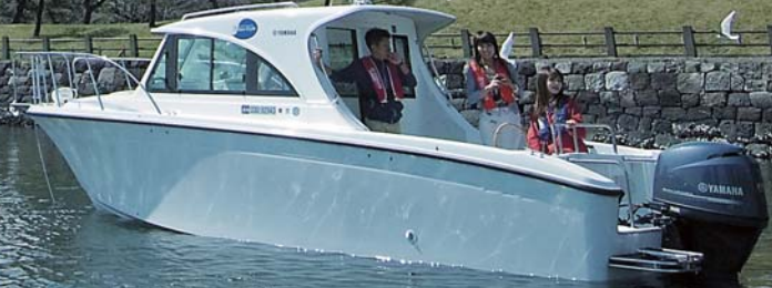
FR-23 ActiveSedan ■全長:7.09m ■全幅:2.55m