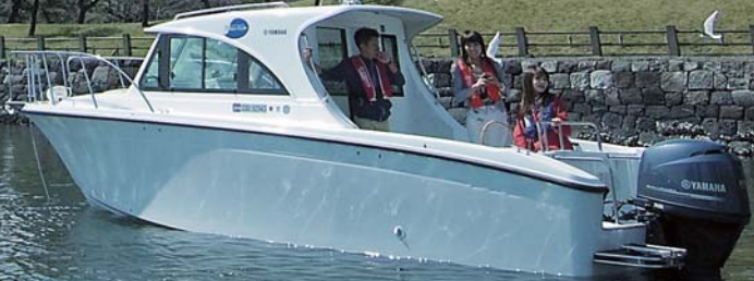
FR-23 ActiveSedan ■全長:7.09m ■全幅:2.55m